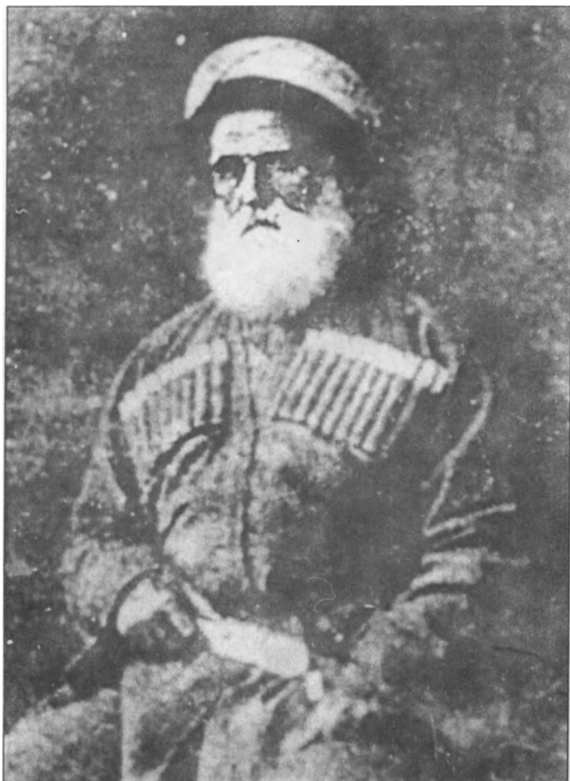
Хаджи-Берзек Керантух (1877 г.)