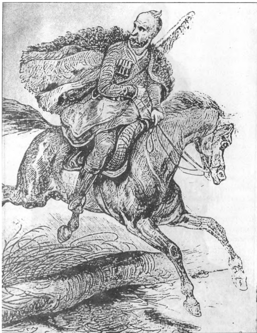
Воин-абхаз (1835 г.)