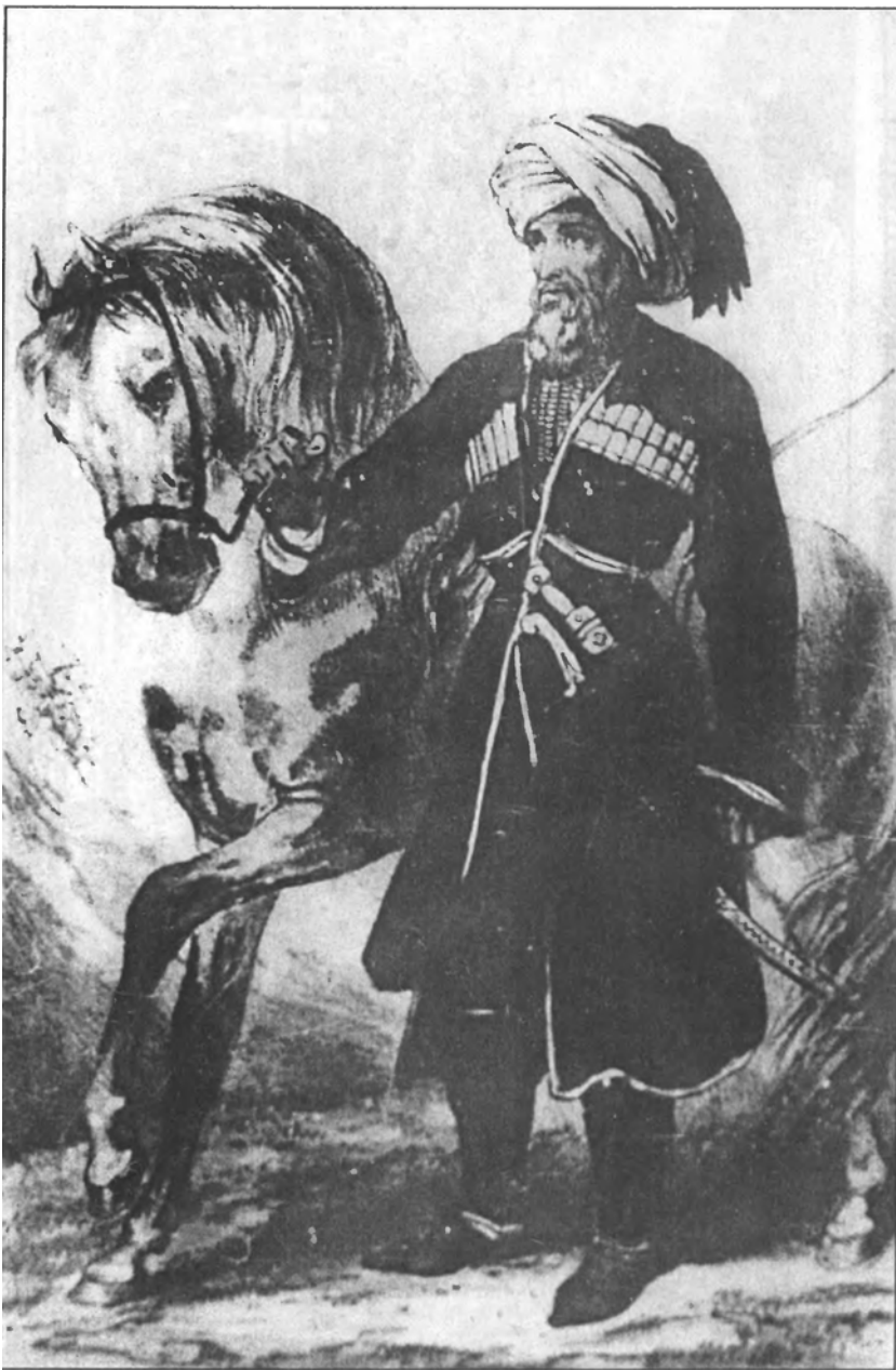
Участник Кавказской войны Хаджи-Гуз (1837г.)