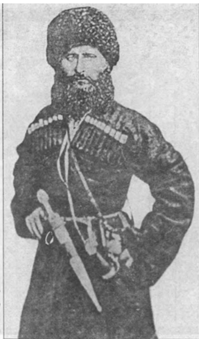
Абазинский дворянин — (II пол. XIX в.)