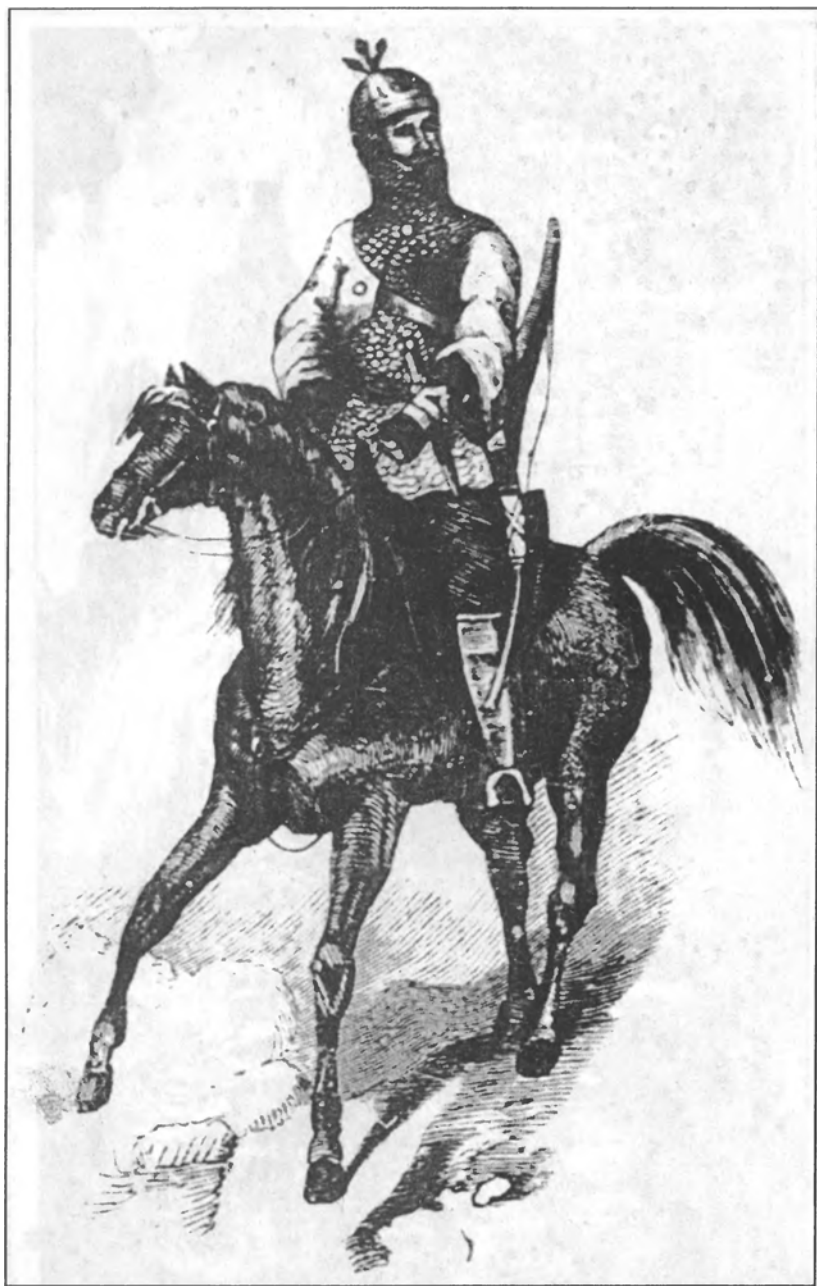
«Конный рыцарь» – «Черкес-воин» (1840 г.)