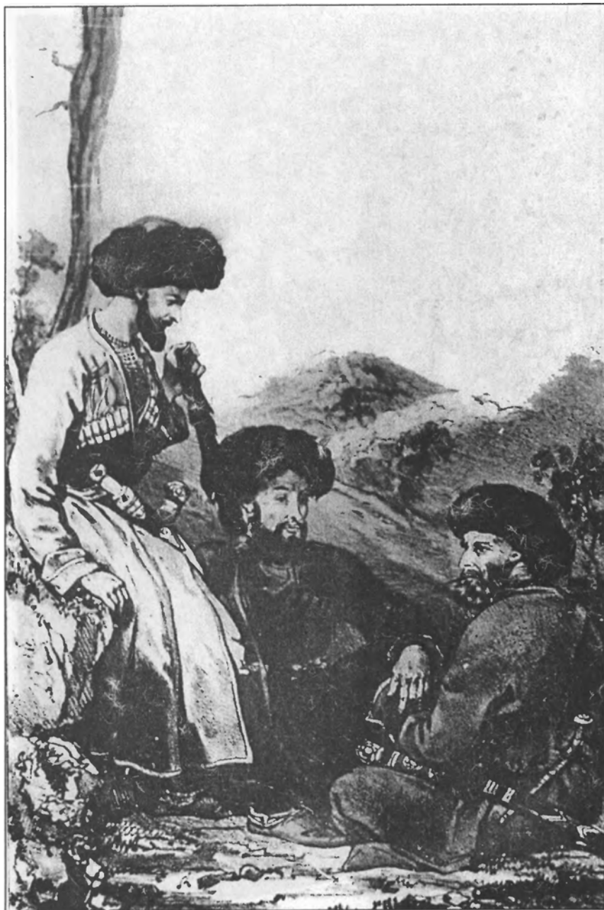
Убыхи (1840 г.)