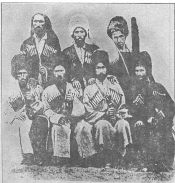
Убыхи (1864 г.)