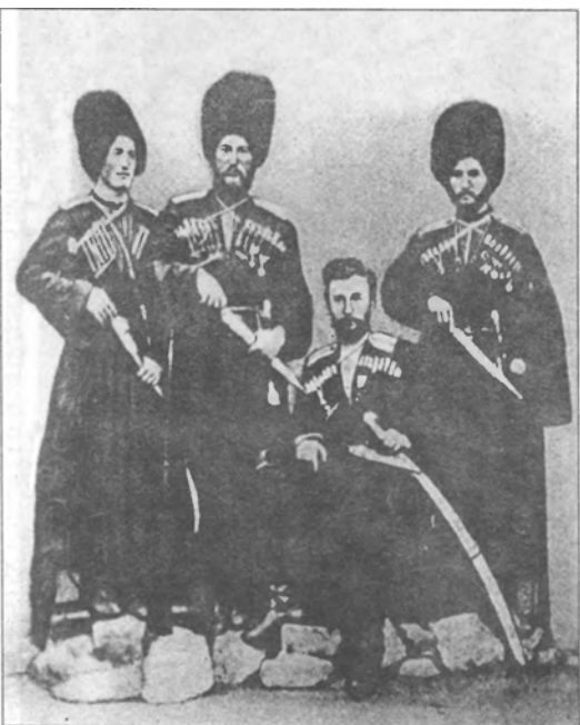
Дал-Цабал, Марщаны (1864 г.)