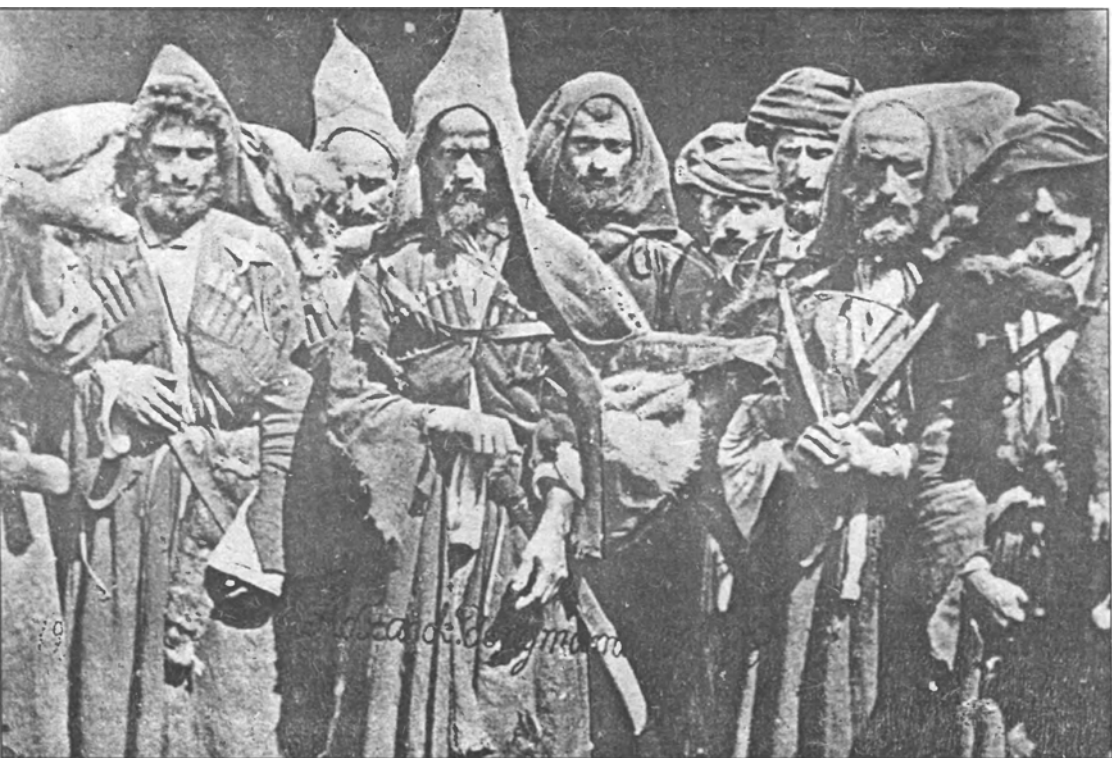
Абхазские депутаты (1866 г.)