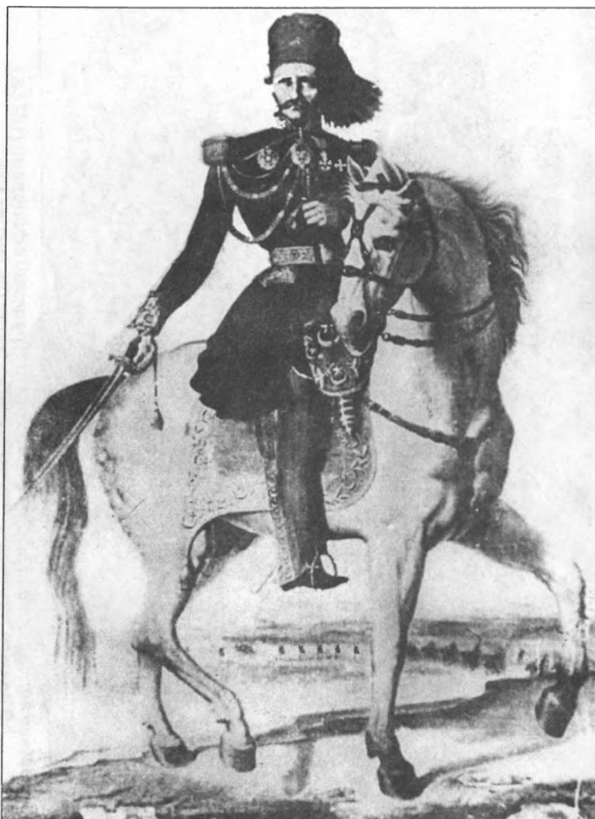
Великий визирь (Премьер-министр) Туниса и Турции, Маршал Хайреддин-паша (1876 г.)