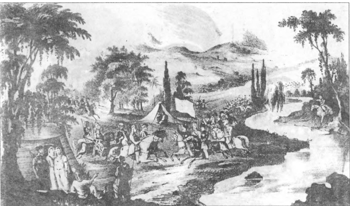
Круговой сбор черкесского войска (адыгов, убыхов, абхазов), Западный Кавказ (1837 г.)