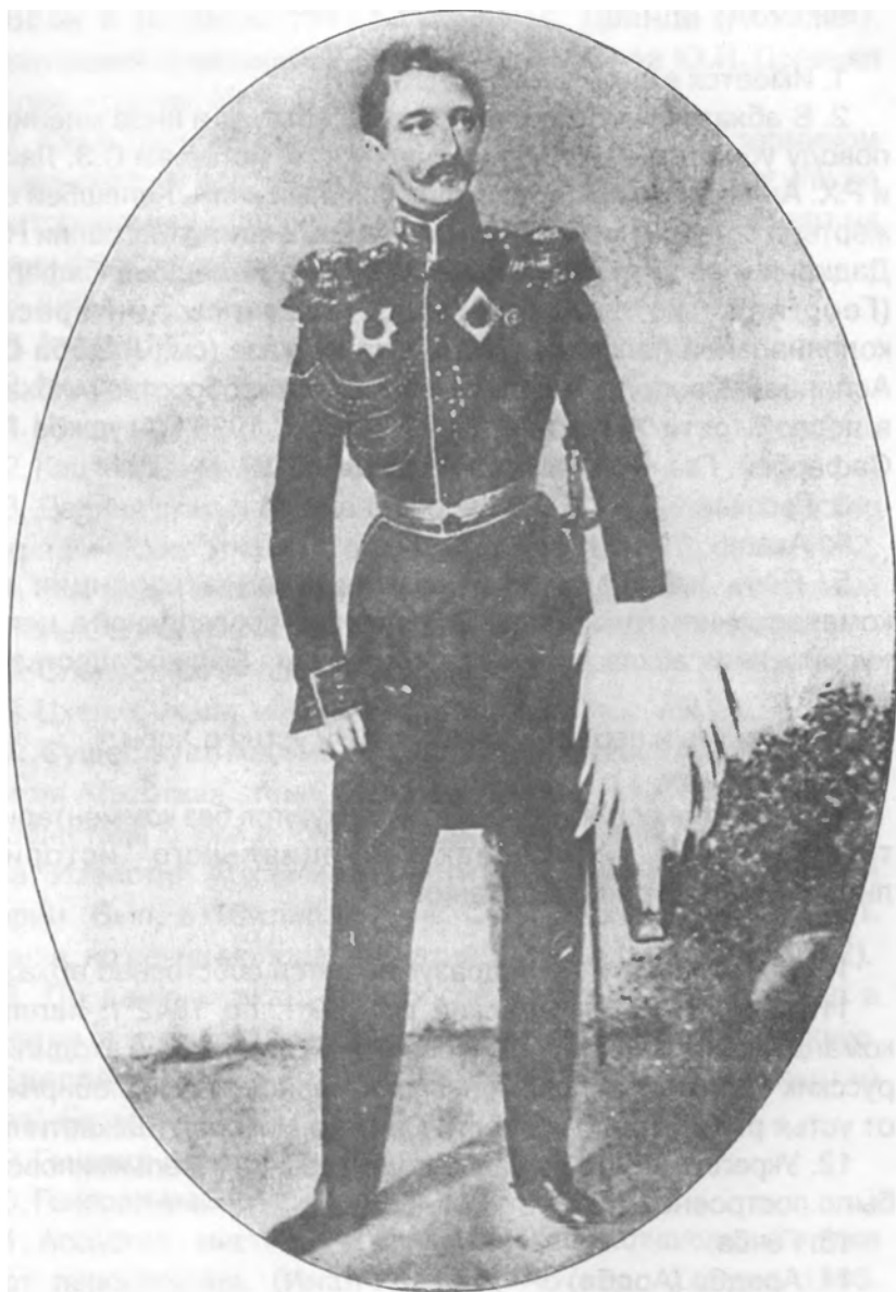
Ахмытбей Чачба – последний владелец Абхазии (1816-1866г.г.)