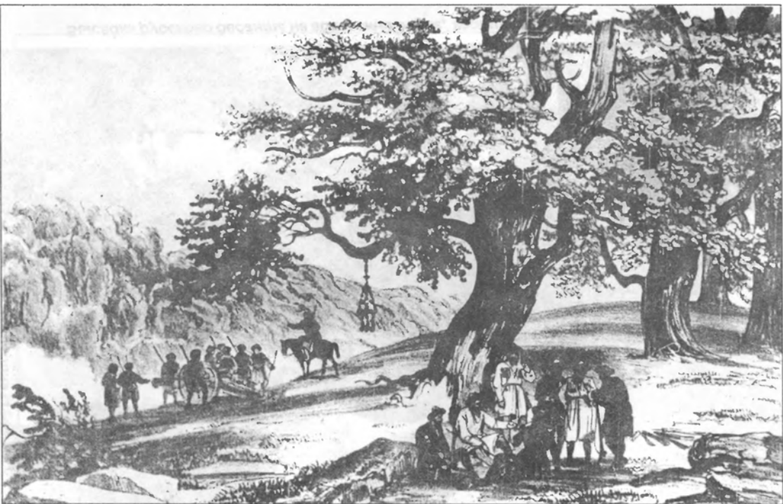
Архныцна-ахэы – древнее святилище абхазов и убыхов в Шача-пста (1837 г.).