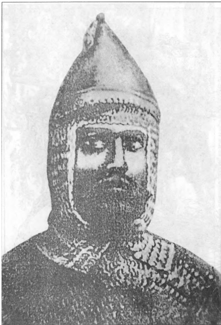
Адджирей-апа Кучук (Халхалба) (1825 г.)