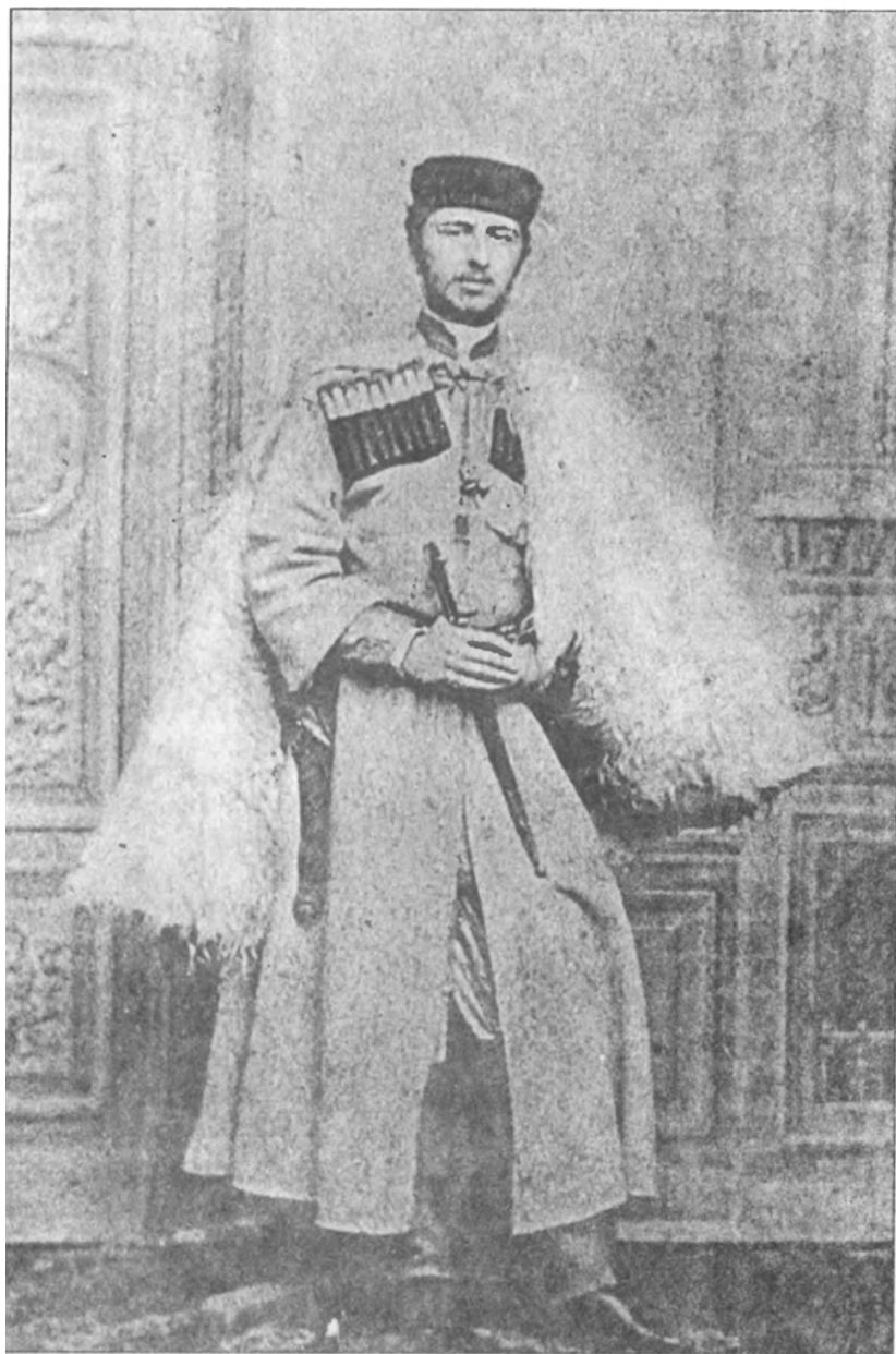
Ах-ипа Гъаргъ Лаша Ачачба (1876 г.)