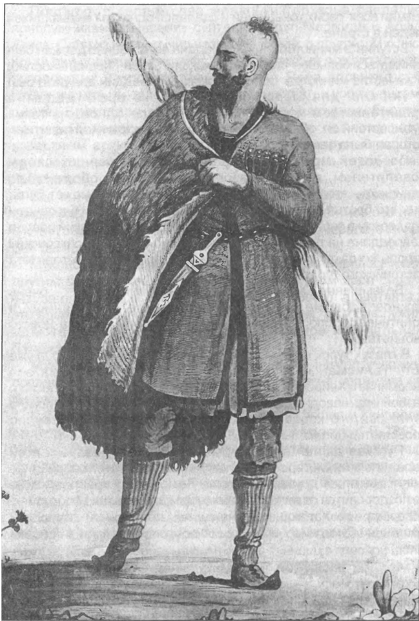
Абхаз из Сухума (1823 г.)