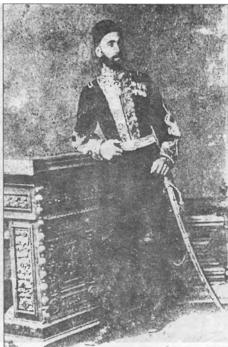
Мухлис- паша (1877 г.)