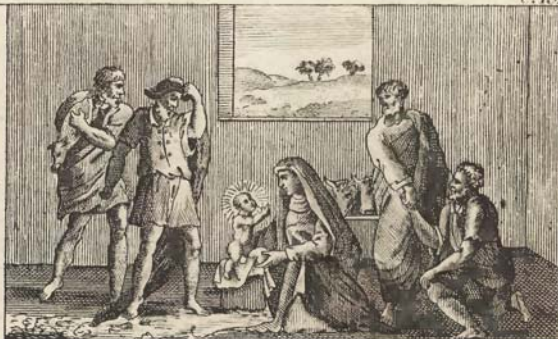
Рождество Господа Іисуса Христа.