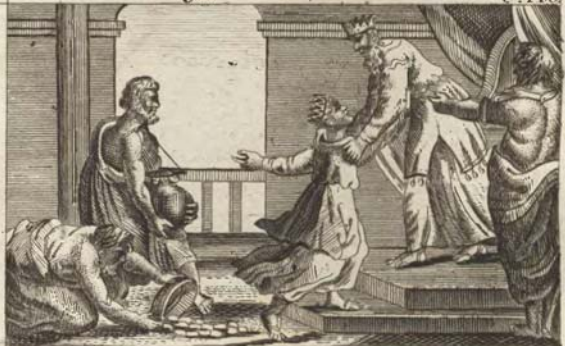
Царница Савская предлагаетъ дары свои Солом.