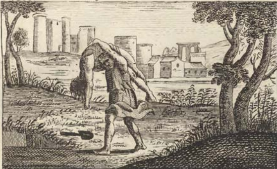
Товитъ погребаесть мертвыхъ.