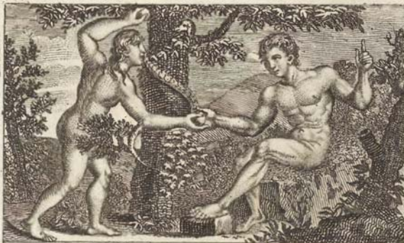
С. 13. Змѣй соблазняетъ Евву.