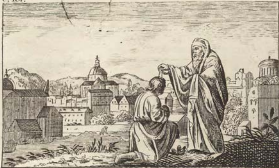
Помазаніе на царство Саула.