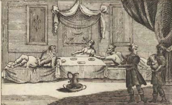
Пиръ даваемый Эсѳирою Ассиру.