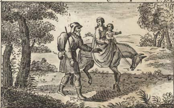
Бѣгство во Египетъ.