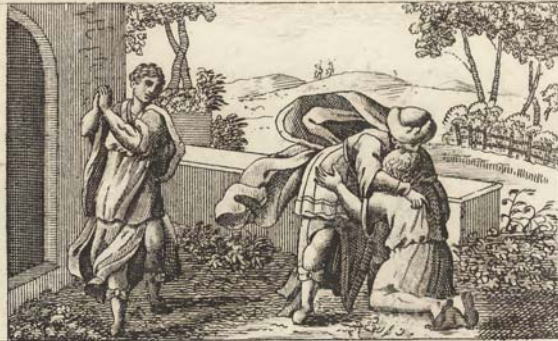
Возвращеніе блуднаго сына къ отцу сво.