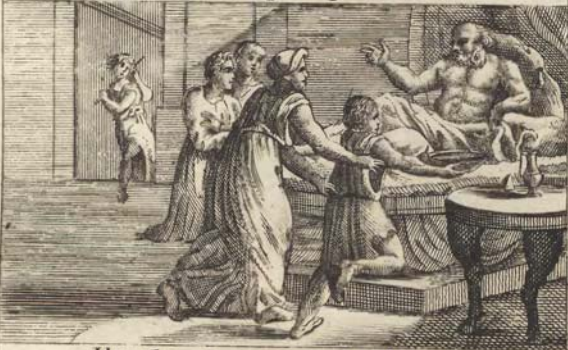
Исаакъ благословляетъ Якова.