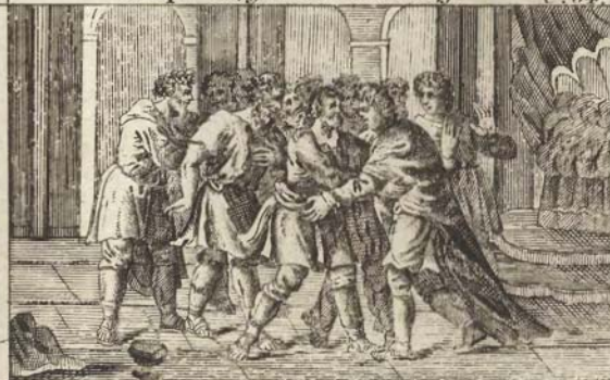
Иосифъ открываеца братьямъ своимъ.