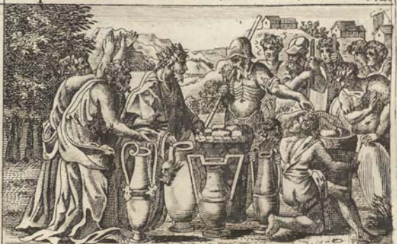
Мелхиседекъ благословляетъ Авраама.