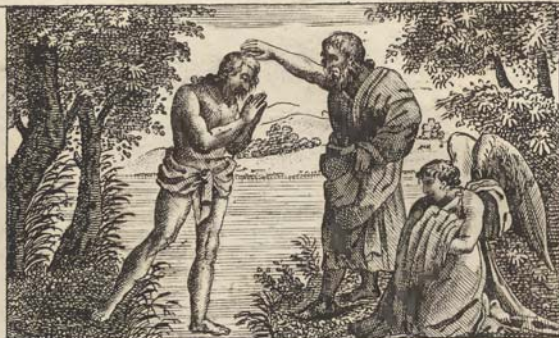
Крещеніе Господа Исуса Христа.