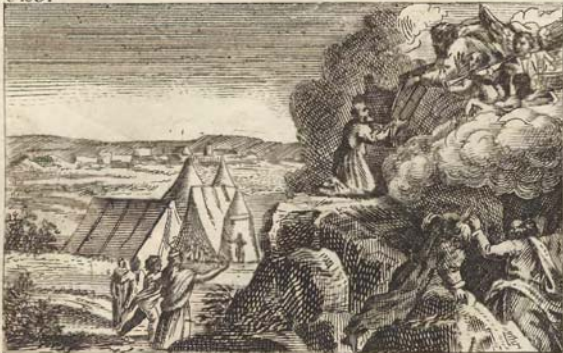
Моисей на Горѣ Синайской.