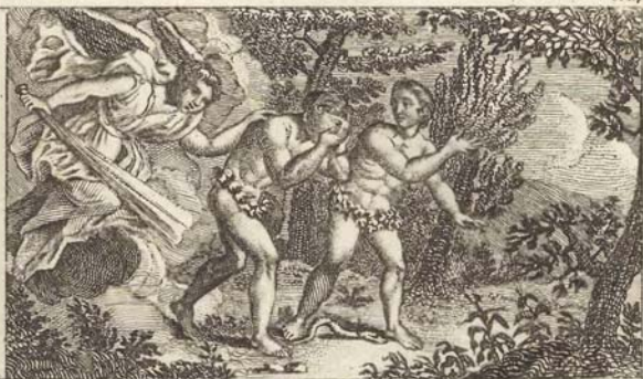
Адамъ и Евва выгнаны изъ Рая.