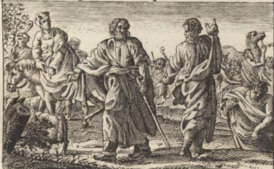
Авраамъ разлучается съ Лотомъ.