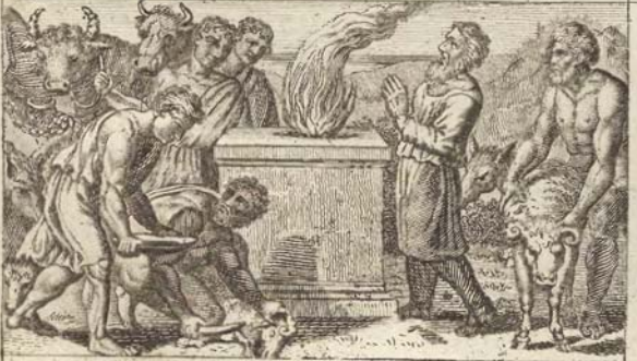
Ной пожираетъ жертвы.