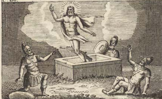
Воскресение Господа Иисуса Христа.