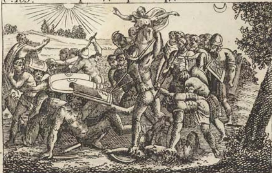
Иисусъ Навинъ останавливаетъ бѣгъ солнца.