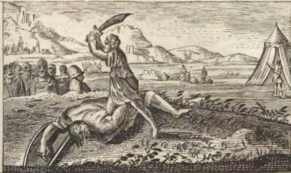
Давидъ убиваетъ великана Голиаса.