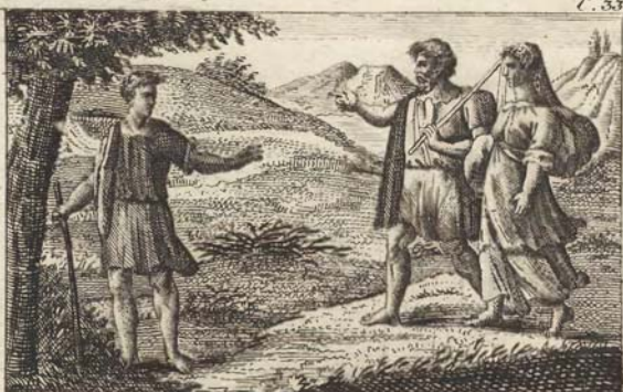
Исаакъ и Ревекка.