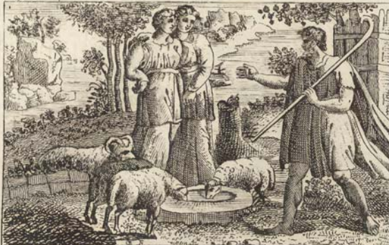
С. 42. Иаковъ встрѣчаетъ Рахиль.