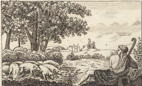
Блудный сынъ стережетъ стада.