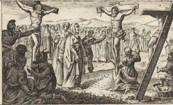
Распятіе Господа Иисуса Христа. C. 277.