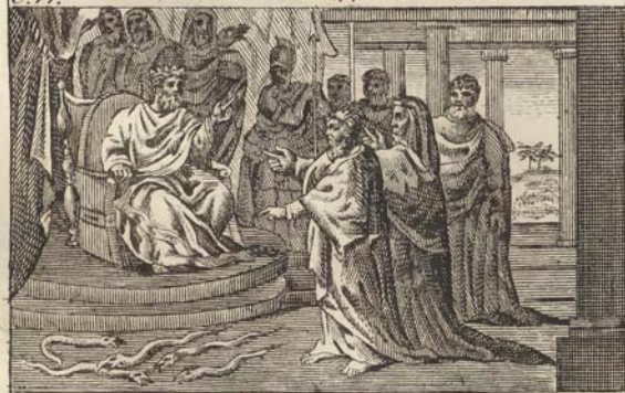
Моисей предъ фараономъ.