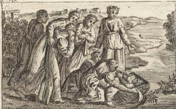
C. 77. Моисей отъ воды спасенный.