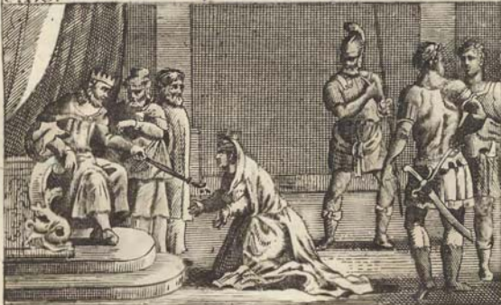
Эсѳиръ пришедшая къ Ассиру.