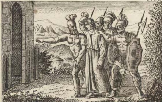
Иосифа вѣдутъ въ темницу.