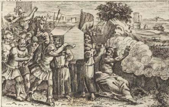
Переходъ чрезъ Юрданъ.