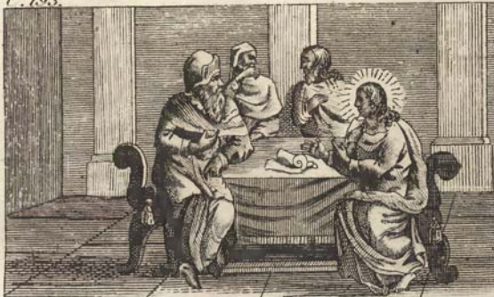
Исусъ между Мудрецами.