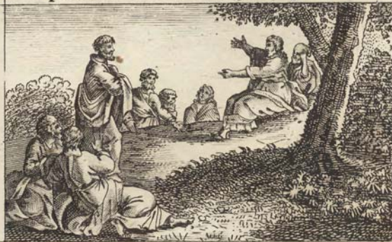
Проповѣдь Говоренная на горѣ.