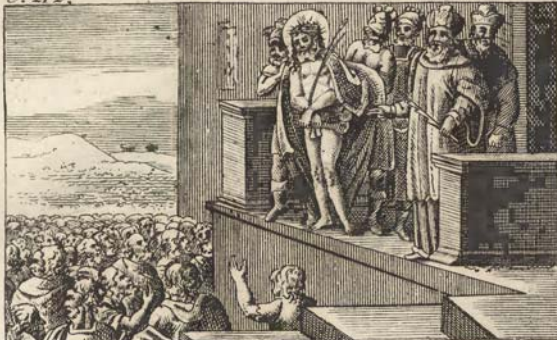
Господа Иисуса Христа показываютъ народу. C. 276.