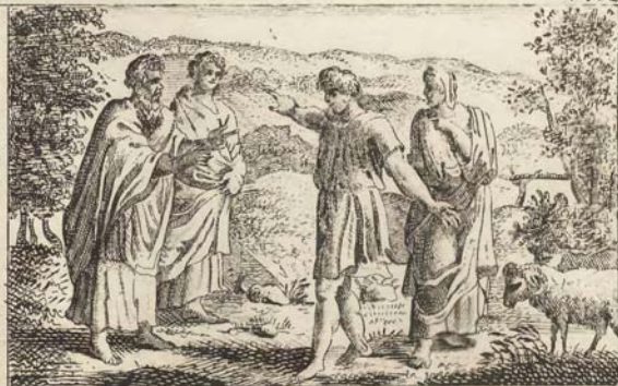
Иаковъ и Лаванъ.