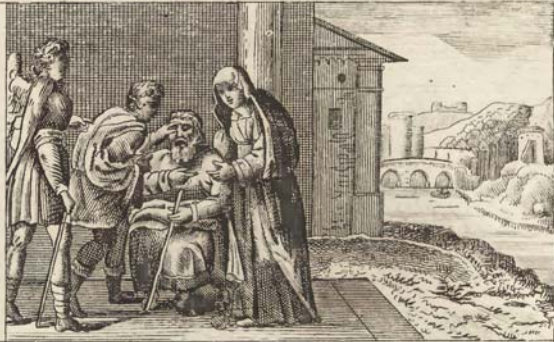
Юный Товитъ возвращаетъ зрѣніе отцу своему.