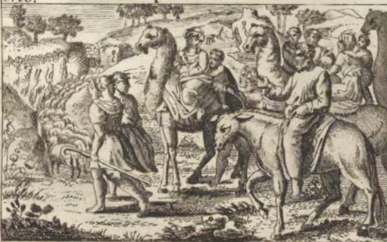
Иаковъ возвращается въ свое отечество.