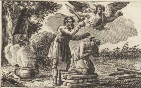
С. 36. Авраамово жертвоприношение.