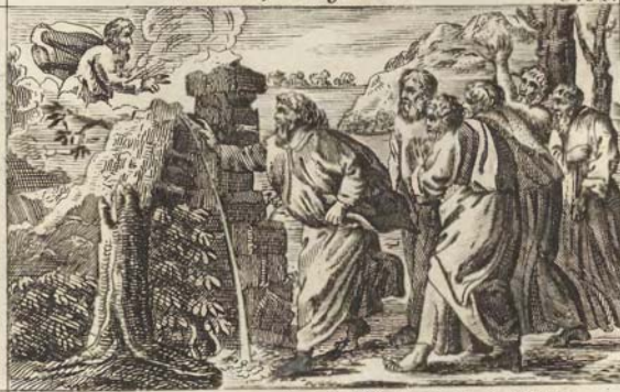
Моисей ударяетъ по скаль Жезломъ своимъ.