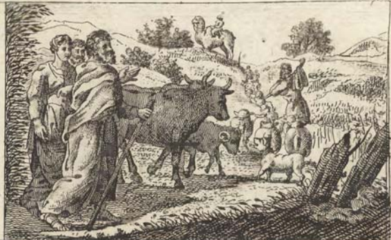
Авраамъ оставляетъ домъ отцевскіи. С. 25.