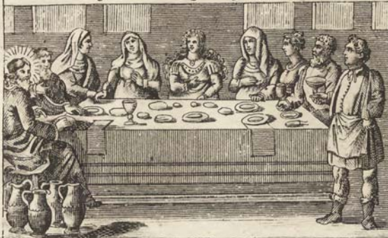
Бракъ въ Канѣ.