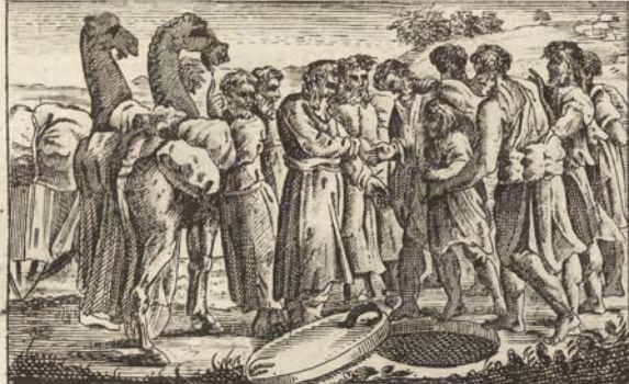
Иосифа продаютъ братья.