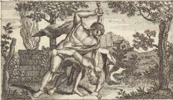
Кайнъ убиваетъ Авеля.