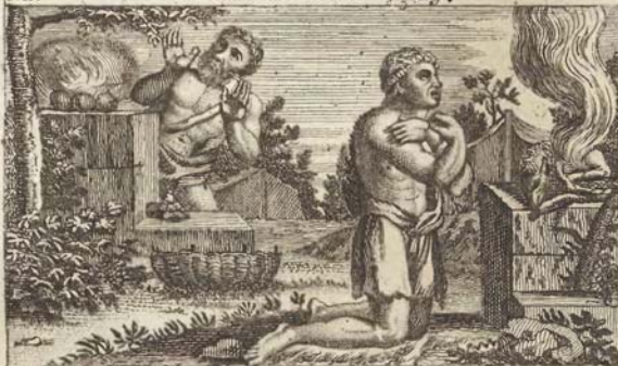
Кайнъ и Авель пожираютъ жертвы.