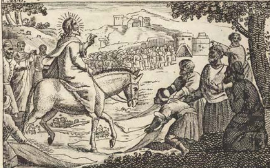
Торжест. въѣздъ Исуса Христа во Іерусалимъ.