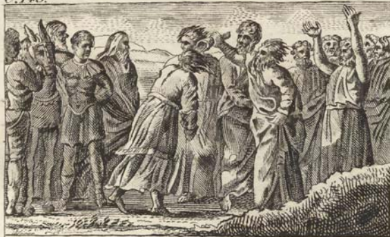
C. 145. Помазаніе на царство Соломона.