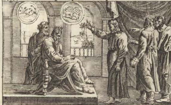
Иосифъ толкуетъ сны фараону.