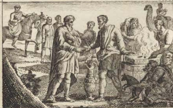
Исавъ примиряется со Иаковомъ.