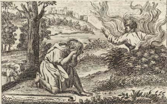
Пылающая Кущина. C. 84.