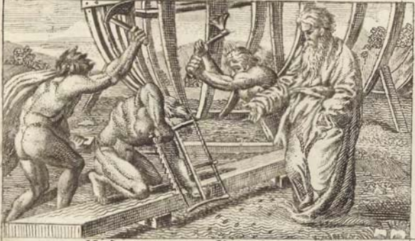
С. 10 Ной строитъ Ковчегъ.